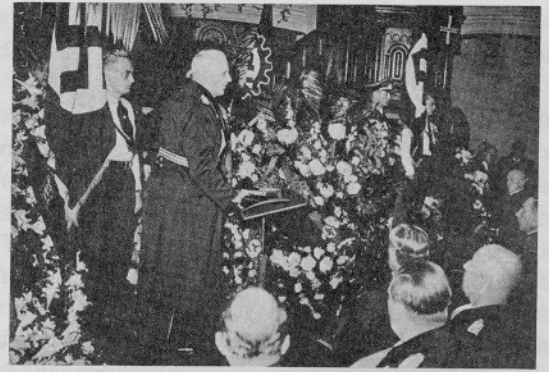
Staatssekretär Ernst von Weizsäcker bei seiner Ansprache während der offiziellen Trauerfeier für Gesandtschaftsrat Ernst vom Rath in Paris.

haben wollen. In Wirklichkeit hatte Hitler -- und das mußte ein Oberstes Parteigericht im Januar/Februar 1939 wissen! -- sofort nach Kenntnisnahme der ersten Ausschreitungen in den frühen Nachtstunden des 10. November an Himmler und dieser an Heydrich und andere eindeutige Befehle erteilt, antijüdische Ausschreitungen sofort zu unterbinden und den Schutz der jüdischen Bevölkerung zu gewährleisten. 70)