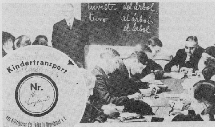
"Kofferaufkleber des Hilfsvereins der Juden in Deutschland für einen Kindertransport nach England (nach dem Novemberprogramm 1938"

(8) Am 9.11.1938 -- 23.55 Uhr waren bereits die meisten Brandlegungen erfolgt, und zwar beginnend mit einsetzender Dunkelheit am späten Nachmittag des 9. November. Das ganze Fernschreiben paßt somit zeitlich gar nicht in die Landschaft.