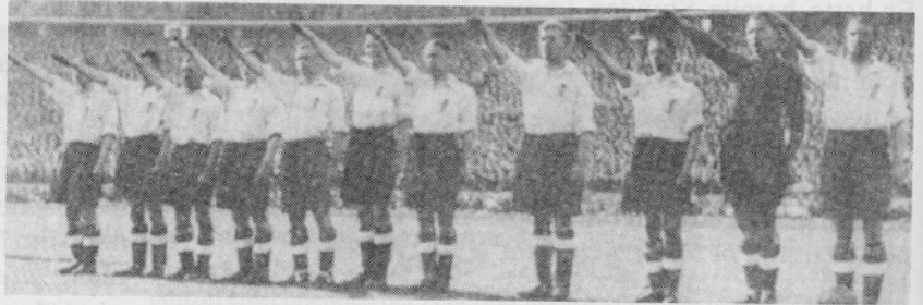
Englische Fußball-Nationalmannschaft vor einem Länderspiel in Berlin 1938 Deutsche Nationalzeitung, München 15.4.1994, S. 8.

muß (Plural!) " ihren Vertretern" heißen.