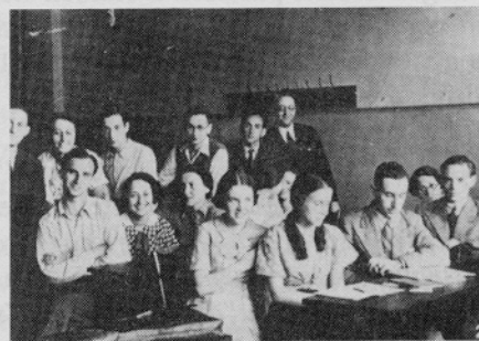
"Hörsaal der jüdischen Lehrerbildungsanstalt, Berlin (1934)"

Text u. Foto in: "Juden in Preußen -- Ein Kapitel deutscher Geschichte", Die bibliophilen Taschenbücher Nr. 259/260, hrsg. v. Bildarchiv Preußischer Kulturbesitz, Dortmund 1981, S. 421.