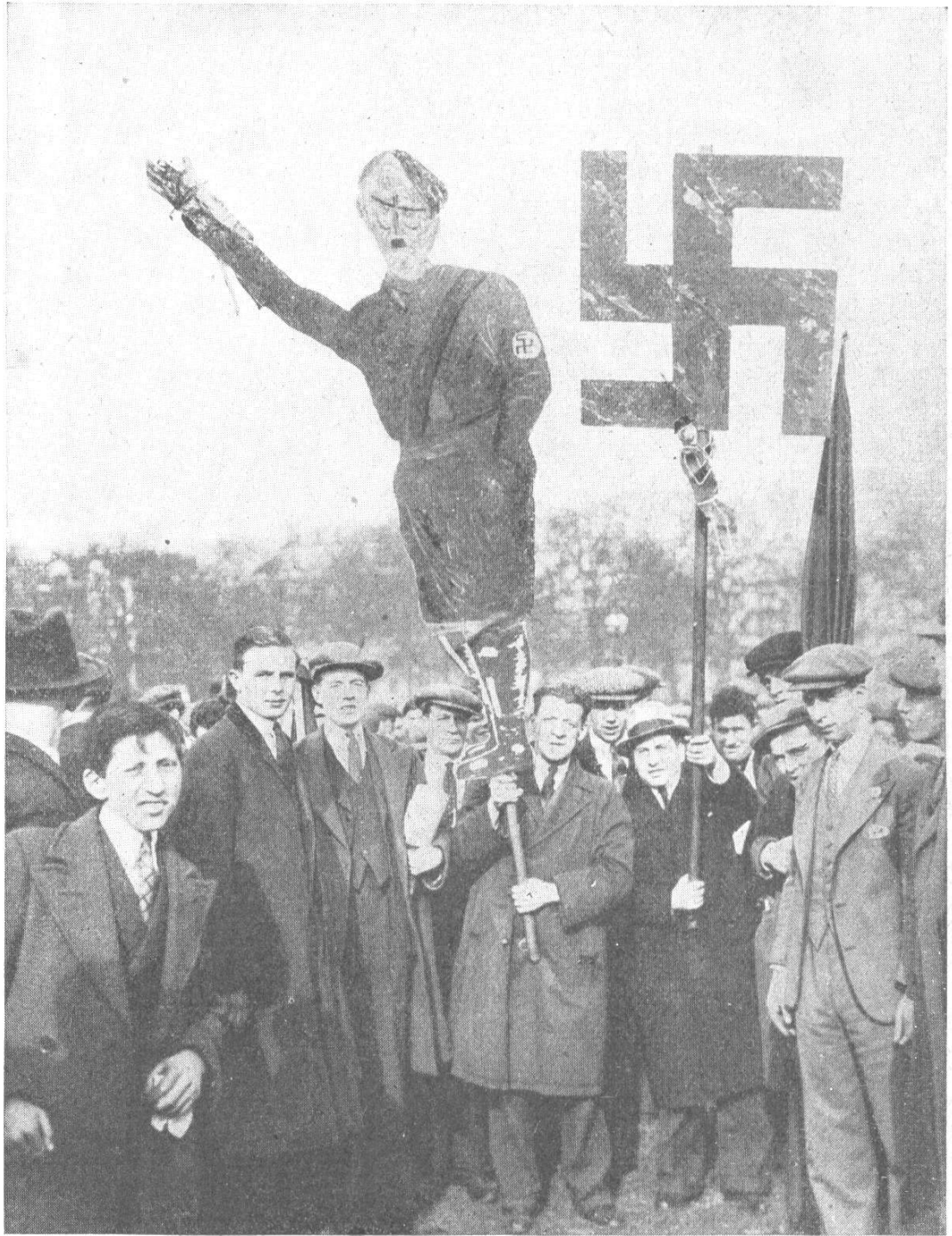
Gemeine Karikatur auf die Führer des deutschen und italienischen Volkes in einem amerikanischen Demonstrationsszug.

iochte Rußland ohne Führer bleibt. Dadurch nehmen wir ihm alle Möglichkeit, sich unserer Macht zu widersetzen.