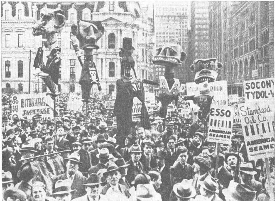
Verhöhnung der Münchner Vereinbarungen in New York. Die Karikaturen stellen den Führer, Chamberlain, Daladier, Mussolini und den japanischen Ministerpräsidenten dar.