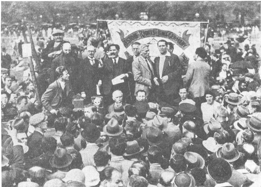
Von Juden geleitete Demonstranten fordern „Wiederherstellung der Rechte“ der Juden in Deutschland. Man beachte links den Rabbiner.

Die Juden selbst machen aus ihren Absichten im übrigen keinen Hehl. Bezeichnend hierfür ist ein Artikel in der internationalen, mehrsprachigen Zeitschrift des Judentums „Ordo, Organe du Comité Juif d'Etude Politiques“ (September=Oktober=Heft) zu dem Thema „Wer ist am Krieg interessiert?“.