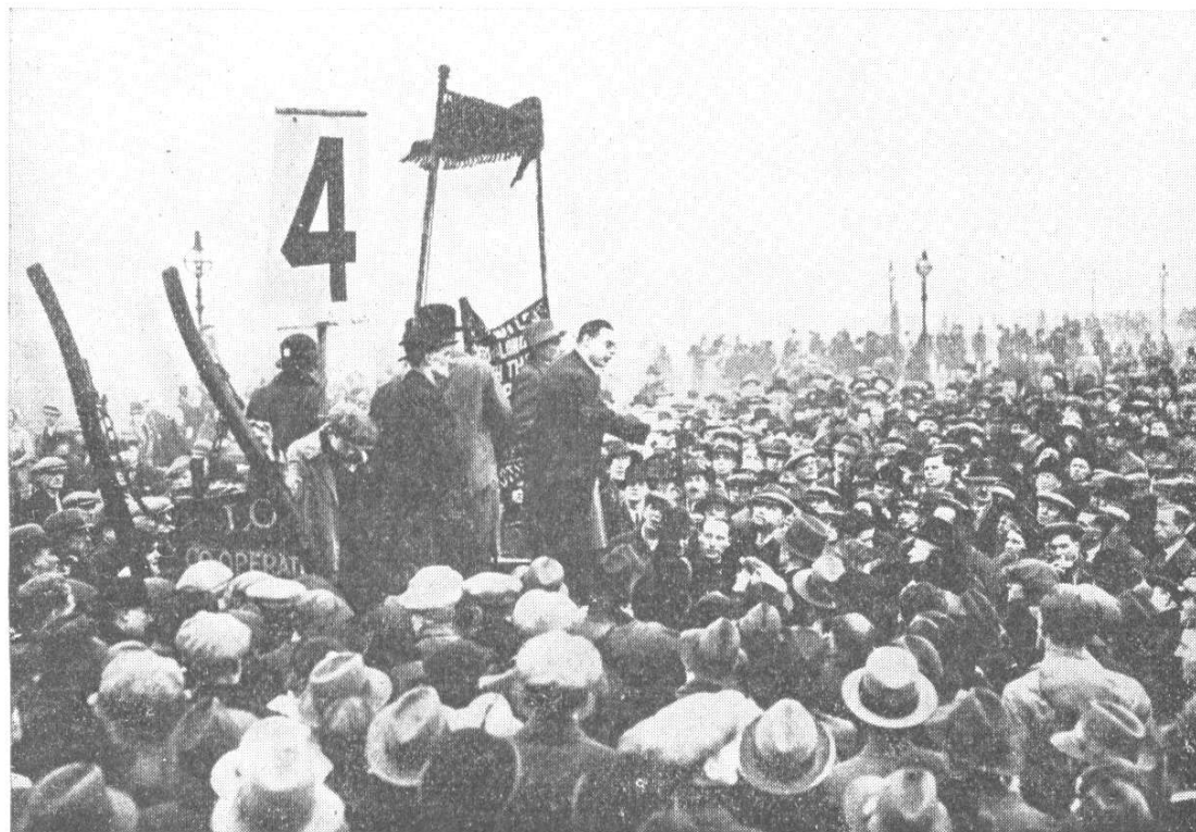
Demonstration gegen den „Geist von München“ in London.

Setzen wir die Blütenlese dieses von den Juden dirigierten und systematisch geschürten Hassfeldzuges fort: Der Gouverneur des Staates New York forderte anlässlich der Eidesablegung seiner vierten Amtsperiode Anfang Januar 1939 das amerikanische Volk auf, seine demokratischen Freiheitsrechte militärisch gegen die Diktatur zu schützen. Wenige Tage zuvor hatte sich die Jüdenschaft New Yorks sogar den Bischof der gleichen Diözese, Donohane, als Redner für eine Hezkundgebung gegen die autoritären Staaten verschrieben, wobei Donohane sich die Geschmacklosigkeit leistete, diesen üblen jüdischen Kummel, als dessen Hauptakteur der berühmte Jude und New Yorker Stadt-