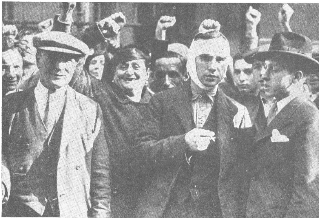
Ausschnitt aus einer Leon-Blum-Kundgebung in Paris.

„Gazette de Lausanne“ weist in ihrer Ausgabe vom 30. Dezember 1938 darauf hin, daß ein weitverzweigtes Komplott zugunsten eines Krieges bestehe. Sie zitiert hierbei das kürzlich erschienene Buch des Juden Emil Ludwig Cohn „La nouvelle sainte Alliance“, das eine einzige Aufhebung zum Krieg gegen die autoritären Staaten ist. In der Schrift fordert Emil Ludwig Cohn Frankreich, England und die Vereinigten Staaten von Amerika auf, vorbeugend gegen das deutsche Volk Krieg zu führen und es in seinem eigenen Blut zu er-