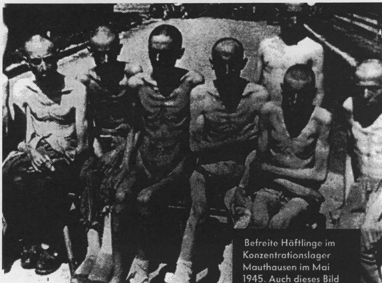
Befreite Häftlinge im Konzentrationslager Mauthausen im Mai 1945. Auch dieses Bild wurde Mahler gezeigt**

Unter dem Titel : " So spricht man mit Nazis -- die Demaskierung eines Staatsfeindes " verwendete Michel Friedman in seinem Interview mit Horst Mahler -- veröffentlicht in der Zeitschrift Vanity Fair , Nr. 45, November 2007, S. 87 das obere, mit Retusche zusammengestellte "Foto" angeblicher -- seltsam ähnlich aussehender -- "Häftlinge aus Mauthausen". Der Vergleich mit einem Originalfoto (unten) enthüllt auch ohne viel Erklärungen die plumpe Machart der Fälschung: Alle Köpfe sind "kunstvoll" mit gleichartig schwarzem "Schatten"-Dreieck aufgesetzt, die Augen durchgängig schwarz, schwarze scharfe Schattenabgrenzungen, überall, unterschiedliche Schattenführungen an den Beinen, unwirklich schwarze Hintergrundpartien.