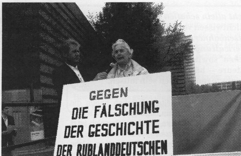
Auf der Demonstration der Rußlanddeutschen vor dem Landtag in Düsseldorf im Mai 2009

"kein Wort davon steht, daß dies der Ort der Judenvernichtung war." 52)