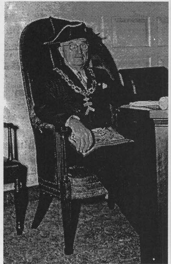
US-Präsident Harry S. Truman im Freimaurerlook am 6. Juni 1951 in Alexandria/Virginia.

Als er Anfang August 1945 befohlen hatte, Hiroshima und Nagasaki mit Atombomben zu belegen, war ihm bekannt, daß Japan bereits seine Bereitschaft zur Kapitulation bekundet hatte. Der Mord an hunderttausenden Zivilisten ist offenkundig. Man braucht kein Gesetz zur Abstrafung von "Leugnern". Weder ist dieser Massenmord gesühnt, noch hat er das Gemüt des "Täters" beeinträchtigt, noch wurde die US-amerikanische Bevölkerung dafür in unbegrenzte Kollektivverantwortung genommen.