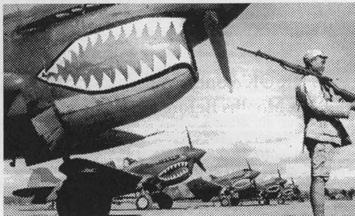
"Flying Tigers" in China im Sommer 1941, bewacht von einem nationalchinesischen Soldaten. 50 B-17-Bomber wären zum Einsatz gekommen, falls die Absicht des Holocausts auf Nagasaki, Osaka und Tokio ausgeführt worden wäre. 10)

Zwar versuchten die japanischen Politiker bis zuletzt, auf diplomatischem Wege die wirtschaftliche Existenzbedrohung wieder aufzuheben, doch mußten sie sich auch Gedanken machen, sich militärisch Zugang zu für sie lebenswichtige Rohstoffquellen im Fernen Osten zu erschließen, auch gegen den Willen der USA und Großbritanniens. Roosevelt zwang sie mit umfassenden