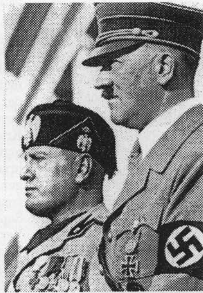
Adolf Hitler und Benito Mussolini

Daß dieser Mann mit seinem jüdischen Anhang seit Jahren nun mit den gleichen Mitteln gegen Japan kämpft, ist uns bekannt. Ich brauche sie hier nicht zur Sprache zu bringen. Auch hier sind dieselben Methoden zur Anwendung gekommen. Erst hetzt dieser Mann zum Krieg, dann fälscht er die Ursachen um, stellt willkürliche Be-