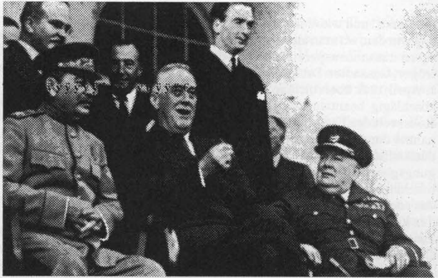
Auf der Konferenz von Teheran (27.11. - 2.12.1943) empfahl Stalin die Erschiebung von 50.000 deutschen Offizieren. F.D. Roosevelt schlug 49.500 vor, -- als "Kompromiß", um Winston Churchills Unmut zu dämpfen. Einig waren sich "die Drei Großen" auch bei der Auslieferung ganz Osteuropas an den Bolschewismus, Vertreibung der ostdeutschen Bevölkerung aus ihrer Heimat und Zerstückelung Deutschlands.

in Washington Constantin Umansky (am 6. November 1941 wurde er durch den Juden Maxim Litwinow-Finkelstein ersetzt) eine Unterredung hatte, seinen Beauftragten für die Englandhilfe Harry Hopkins von London nach Moskau, um Stalin ein amerikanisches Unterstützungsangebot zu machen. In diesem Zusammenhang spielte eine besondere Rolle die auf Roosevelts und Churchills Vorschlag abgehaltene Moskauer Konferenz vom 29. September bis 1. Oktober 1941 auf der amerikanische und britische Vertreter mit den Bolschewisten über die Regelung der Hilfeleistung an die Sowjetunion verhandelten. Aus diesem Anlaß richtete Roosevelt an seinen "lieben Freund Stalin " eine persönliche Botschaft, in der er u. a. erklärte: