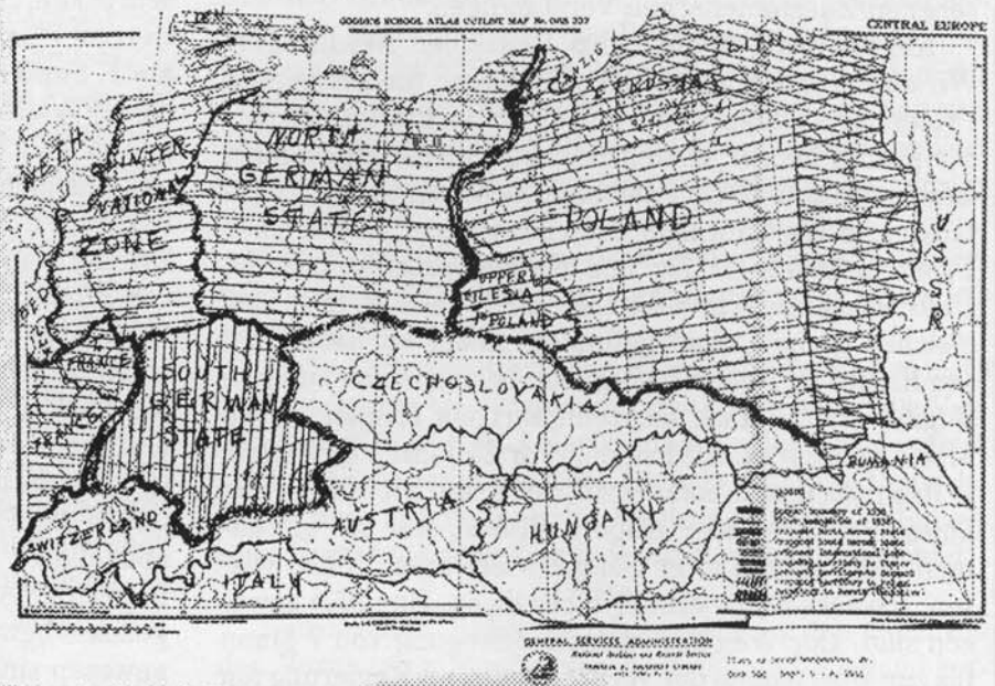
Morgenthau's Deutschland-Plan, abgedruckt in: "Morgenthau Diary (Germany)", US Government Printing Office, Washington 1967, Volume I. p. 555.

für den Holocaust von Berlin nicht mit irgendwelchen Untaten der Deutschen begründet! Von einem erst nach dem Krieg bekanntgemachten "Deutschen Holocaust gegen die europäischen Juden" hatte er nichts gewußt! Seine begründungslose Volksmord-Zielsetzung entsprach genau jenen, die bereits vom britischen und US-amerikanischen Boden aus 1933 Deutschland den Krieg bis zur Existenzvernichtung erklärt hatten.