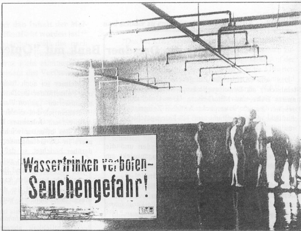
Häftlings-Duschenanlage in einem deutschen Konzentrationslager

Das sich aus dem Präparat Zyklon B abscheidende Wasserstoffzyanid (HCN) ist flüchtig und hat einen Siedepunkt von etwa 27° C. Auf Grund seines sauren Charakters bildet es in Verbindung mit Metallen Salze, die Zyanide genannt werden. Alkalische Salze (z.B. Natrium und Kalium) sind wasserlöslich. -- Wasserstoffzyanid ist eine sehr schwache Säure, und daher lösen sich seine Salze leicht in stärkeren Säuren auf. Eine von diesen Säuren ist sogar Kohlensäure, die sich bei der Reaktion von Bicarbonoxyd mit Wasser bildet. Eine leichtere Auflösung der Zyanide bewirken stärkere Säuren wie z.B. Schwefelsäure. Dauerhafter sind die Verbindungen des Zyanid-Ions mit schweren Metallen. Zu diesen gehört das schon erwähnte Preußischblau, aber auch dies löst sich in einer sauren Umgebung langsam auf.