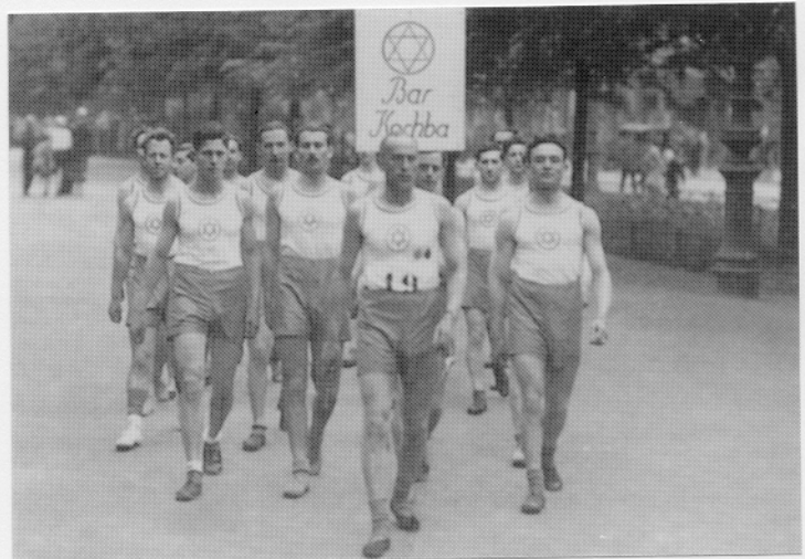
Der Stettiner Sportverein »Bar Kochba« 1929

Zum Schluß ist noch zu berichten, daß mir 14 Tage nach der Ratifizierung des Israel-Vertrages [1952] von jüdischer Seite für das der Bundesregierung übergebene Memorandum zum Israel-Vertrag DM 30.000,- geboten wurden. Ich hätte sie gerne genommen. Ich konnte sie -- ich war arm wie Millionen deutscher, europäischer Schicksalsgenossen -- gut gebrauchen. Aber aus dem »Geschäftchen« konnte nichts werden. Es war eine kleine Bedingung daran geknüpft. Ich sollte vor Erhalt des Geldes eine Erklärung unterzeichnen, daß dieses Memorandum nie existent gewesen sei. Auf meine bescheidene Frage, wen man alsdann mit dieser Erklärung erpressen wolle, die Bundesregierung oder mich?, erhielt ich keine Antwort. ..."