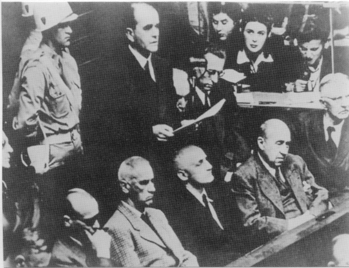
Der als Hauptkriegsverbrecher angeklagte Albert Speer bei seinem Schlußwort in Nürnberg, August 1946