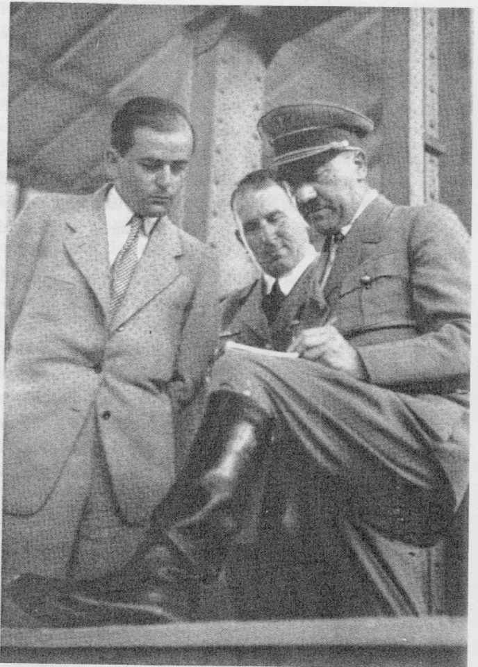
Der Führer und sein Architekt, als sie sich noch mit Bauplanungen im Reich befaßten.

"Ich halte das Affidavit für erlogen. Ich möchte sagen, in dem deutschen Volk gibt es etwas Derartiges nicht. Und wenn derartige Einzelfälle auftraten, dann wurden sie bestraft bei