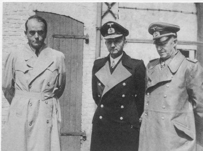
Nach Absetzung und Gefangennahme der Regierung Dönitz im Mai 1945. (Von links) Albert Speer, Großadmiral Karl Dönitz, Generaloberst Alfred Jodl.

"Falsch wäre es zu glauben, daß sich die führenden Leute, wenn sie sich selten genug trafen, mit ihren Untaten gebrüstet hätten. Im [Nürnberger] Prozeß wurden wir zwar mit den Chefs einer Mafia verglichen. Ich erinnere mich an Filme, in denen die Bosse der legendären Gangs im Smoking zusammensaßen, sich über Mord und Macht unterhielten, Intrigen spannen, Coups ausheckten. Doch diese Atmosphäre von Dunkelmännern, Hinterstube und Verschwörung war von der unseren weit entfernt." 44) S. 43 - 44