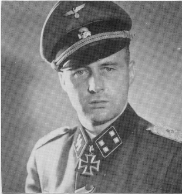
Christian Wirth, Foto aus seiner Personalakte des Bundesarchivs, Berlin, Finkensteinallee 63.