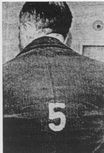
Mit Hilfe einer in die Spandauer Zelle eingeschmuggelten Kleinbildkamera wurde diese Aufnahme des "Kriegsverbrechers Nr. 5" gemacht. Den Gefängnisvorschriften gemäß durften die Gefangenen nicht mit Namen, sondern mußten mit ihrer Nummer angedeutet werden.

"Diese Juden werden vermutlich in den deutschen Fabriken arbeiten müssen, die unlängst in den Bezirk Krakau verlegt worden sind." 74) S. 232