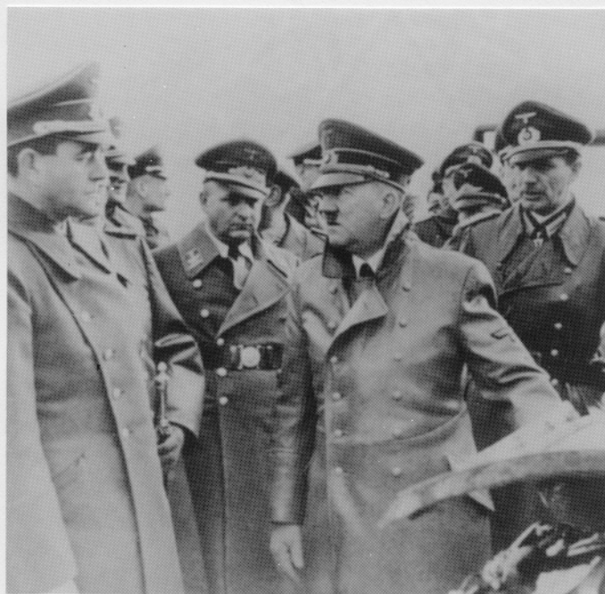
Speer bei der Vorführung neuer Waffen 1943 im Gespräch mit dem Führer und Reichskanzler. In der Mitte Karl Otto Saur, Hauptdienststellenleiter im Speer-Ministerium; ab März 1944 leitete er den Jägerstab. Im Juni 1944 war nach Amtsauflösung des Generalluftzeugmeisters Albert Speer auch die Luftrüstung unterstellt worden.

Freilich obliegt es dem Historiker, hier nachzuarbeiten,