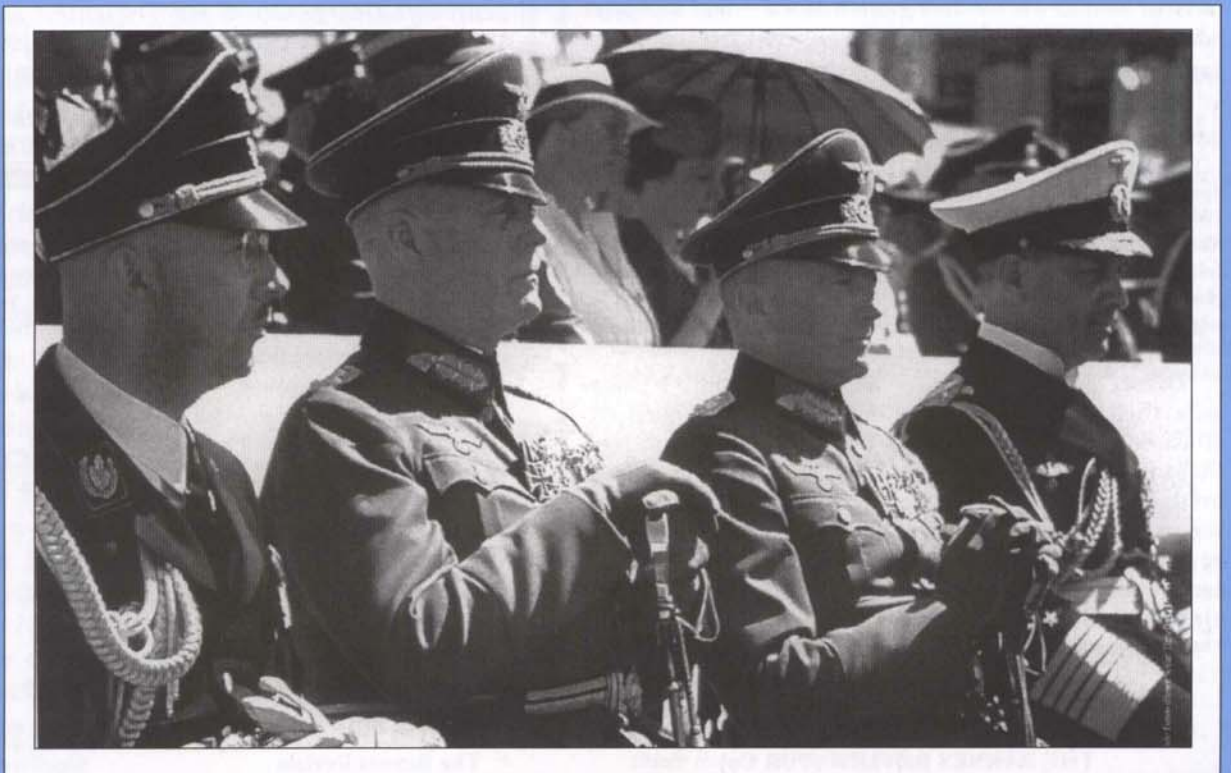
Am 6. April 1939 auf dem Reichskriegertag in Kassel. Die Repräsentanten der deutschen Wehrhoheit wollten gemeinsam nur eines: Die Souveränität des Reiches gewährleisten. Von links: Heinrich Himmler, Generaloberst Wilhelm Keitel, Oberbefehlshaber des Heeres Walter v. Brauchitsch, Großadmiral Erich Raeder.