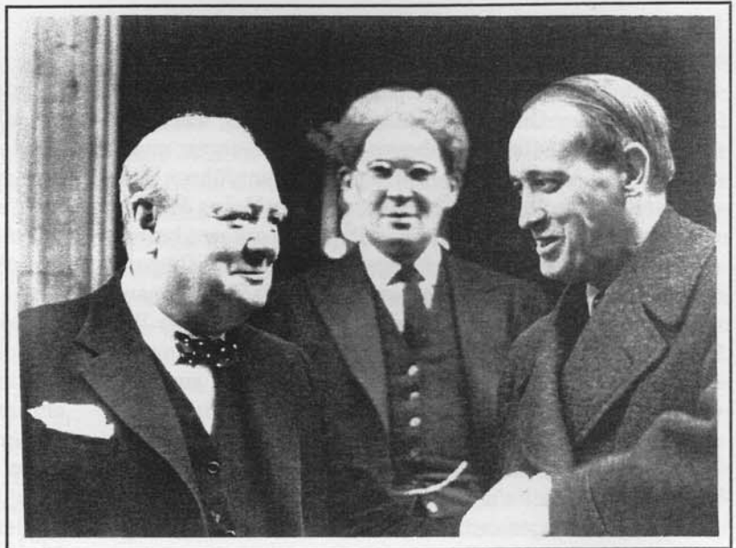
Von links: Britanniens Kriegspremier Winston Churchill, sein "Informationsminister" Brandon Bracken und US-Sonderbotschafter Harry Hopkins.

Ohne sich mit Weiterem aufzuhalten, ließ der britische Oberst den in Unterhose und Socken gekleideten, in eine Decke gehüllten und zusammengeschnürten Himmler un-