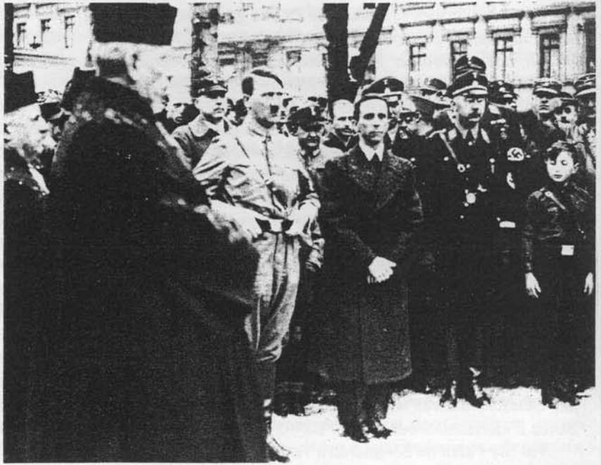
Hitler, Goebbels und Himmler am 22. Januar 1933 auf dem Nikolai-Friedhof in Berlin während der Gedenkfeier am Grabe Horst Wessels

"Wir wollen hier nicht irgendwie einen Ausrottungskrieg gegen ein Volkstum führen. Der Schutz des Reiches über das polnische Volk in dieser deutschen Interessenzzone bedeutet für Sie die Möglichkeit, sich getreu der Überlieferungen Ihres Volkes zu entwickeln. Was ich verlangen muß, ist der Gehorsam gegenüber den Waffen des Führers und den Anordnungen des Reiches. Ich glaube, daß es dann auch durchaus für Ihre Nation die Möglichkeit einer friedlichen Entwicklung und einer ertragreichen Arbeit gibt. Was an mir