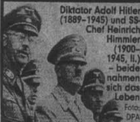
Diktator Adolf Hitler (1889-1945) und SS-Chef Heinrich Himmler (1900-1945, II.) - beide nahmen sich das Leben.