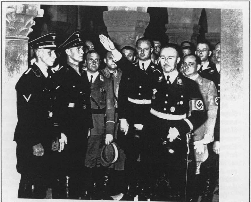
Feierstunde in der Wewelsburg

"Zu diesem Zeitpunkt wurde er nicht ersucht, den Mund zu öffnen, weil ich dachte, wenn die Kapsel in seinem Mund sei und wir versuchten, sie herauszunehmen, könnten wir ihn zu einer Handlung bewegen, die nicht in unserem Interesse lag. Ich bestellte jedoch dicke Käsesandwiches und Tee, die ich Himmler anbot, in der Hoffnung zu sehen, ob er etwas aus