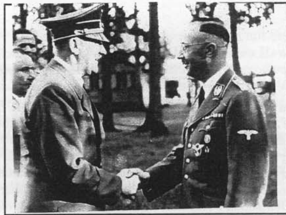
Der Führer beglückwünscht Himmler zu seinem 43. Geburtstag (1943)

Ich denke nämlich immer noch daran, am Ende des Krieges unsere ganzen Männer der SS und Polizei auf