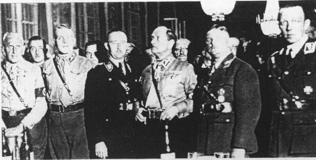
Nach erfolgreicher Reichstagswahl vereidigte Adolf Hitler seine Reichstagsabgeordneten im Sommer 1932 im Hotel Kaiserhof, Berlin auf die gemeinsame Parteilinie. (von rechts: Graf Helldorf, Röhm, Ritter v. Epp, Himmler, Heines, v. Ulrich.

fern zwangsdeportiert haben, ohne daß die Welt daran Anstoß nahm, erfolgten Reaktionen der deutschen Führung u.a. auf dieses Vorgehen zwecks Isolierung mutmaßlicher Feindkräfte in einem Vernichtungskrieg gegen das deutsche Volk einschließlich eines brutalen Partisanenkampfes. Diese Reaktionen jedoch sogleich bei Ausklammerung der genannten Zusammenhänge mit "Ausrottungsmaßnahmen" gleichzusetzen und die Beweismittelfindung hierfür "einer kleinen Armee begabter Schwarz-Propagandisten" zu überlassen (vergl. S. 2) und nachfolgende neutrale wissenschaftliche Überprüfungen zu vereiteln, ist infam!