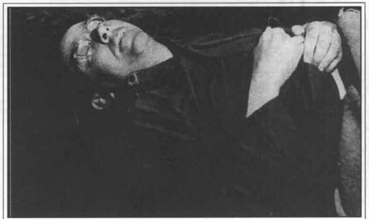
Der Leichnam Heinrich Himmlers, aufgenommen am 24. Mai 1945. 56) dort weitere Fotos S. 160 ff.

Der britische Informationsminister, Erster Lord der Admiralität und einer der engsten Berater des Premierministers, Brendan Bracken , hatte während seiner Dienstzeit -- vor allem während des Krieges -- so viel üble Täter-Aktivitäten auf sein Gewissen geladen -- man denke nur an seine Anweisung am 29. Februar 1944, angesichts der zu erwartenden Bestialitäten beim weiteren Vormarsch der Roten Armee in Osteuropa die Weltöffentlichkeit davon mittels verstärkter Greuelpropaganda gegen Deutschland abzulenken 63) --, daß er noch vor seinem Tod alle seine persönlichen Unterlagen vernichten ließ. Dennoch blieb vieles rekonstruierbar, weil ein aus zahllosen Zusammenhängen bestehendes Geschehen seine vielfältigen Spuren hinterläßt, die sich nicht alle verwischen oder gar vernichten lassen.