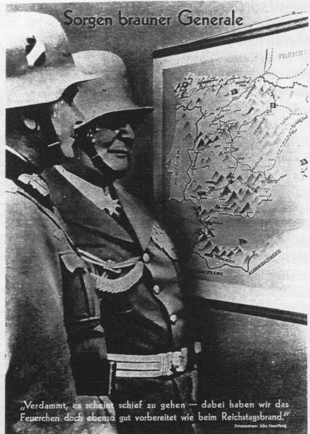
Sorgen brauner Generale „Verdammt, es scheint schief zu gehen – dabei haben wir das Feuerchen doch ebenso gut vorbereitet wie beim Reichstagsbrand.“ Die Hetze galt ihnen allen schon lange vor Ausbruch des Krieges Beschriftung: "Sorgen brauner Generale" »Verdammt, es scheint schief zu gehen – dabei haben wir das Feuerchen doch ebenso gut vorbereitet wie beim Reichstagsbrand.«"

Während die Sowjetbehörden Hunderttausende, ja Millionen Menschen total enteignet und unter unwürdigsten Verhältnissen bei Inkaufnahme gewaltiger Zahlen an Op-