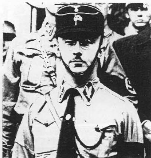
Reichsführer-SS Heinrich Himmler

"Selten benutzte er einen vorbereiteten Text. In den vorliegenden Dokumenten lassen sich nur 4 oder 5 solcher Texte feststellen. Gewöhnlich entwickelte er seine Reden aus Notizen, die er selbst in der deutschen Schreibschrift niederschrieb, manchmal nicht mehr als ein Dutzend Worte, aber oft detaillierte Skizzen von 4, 5, in manchen Fällen nicht weniger als 8 flüchtig geschriebenen Seiten. Fast 70 dieser Stichwortsammlungen sind erhalten.