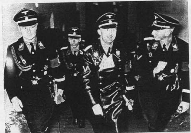
Heinrich Himmler mit seinem Adjutanten Karl Wolff (links) und Reinhard Heydrich (rechts).

Wird auch in den Quellenbezügen zuweilen auf die typisch primitiven, wortschatzarmen Pauschalformulierungen ohne konkrete Aussagekraft in zahlreichen " Himmler-Reden " als "typisch Himmler " und somit auf die "Echtheit" der "Dokumente" verwiesen, so wären die Herausgeber besser beraten gewesen, auf ein und denselben Textfälscher zu verweisen, der die deutsche Sprache nicht richtig beherrschte. Immerhin hatte Himmler jahrelang eine Führungsposition inne, die hohe Qualifikation zumindest in seiner Ausdrucksweise voraussetzte und die auch anerkannt war -- jedenfalls nie Anlaß zur Kritik gegeben hatte -- bei den Militärs, Wissenschaftlern und Wirtschaftsführern seines "Freundeskreises Himmler ", mit denen er ständig Kontakt pflegte. Einen Vergleich mit seinen Vorkriegsreden haben diese Leute typischerweise unterlassen.