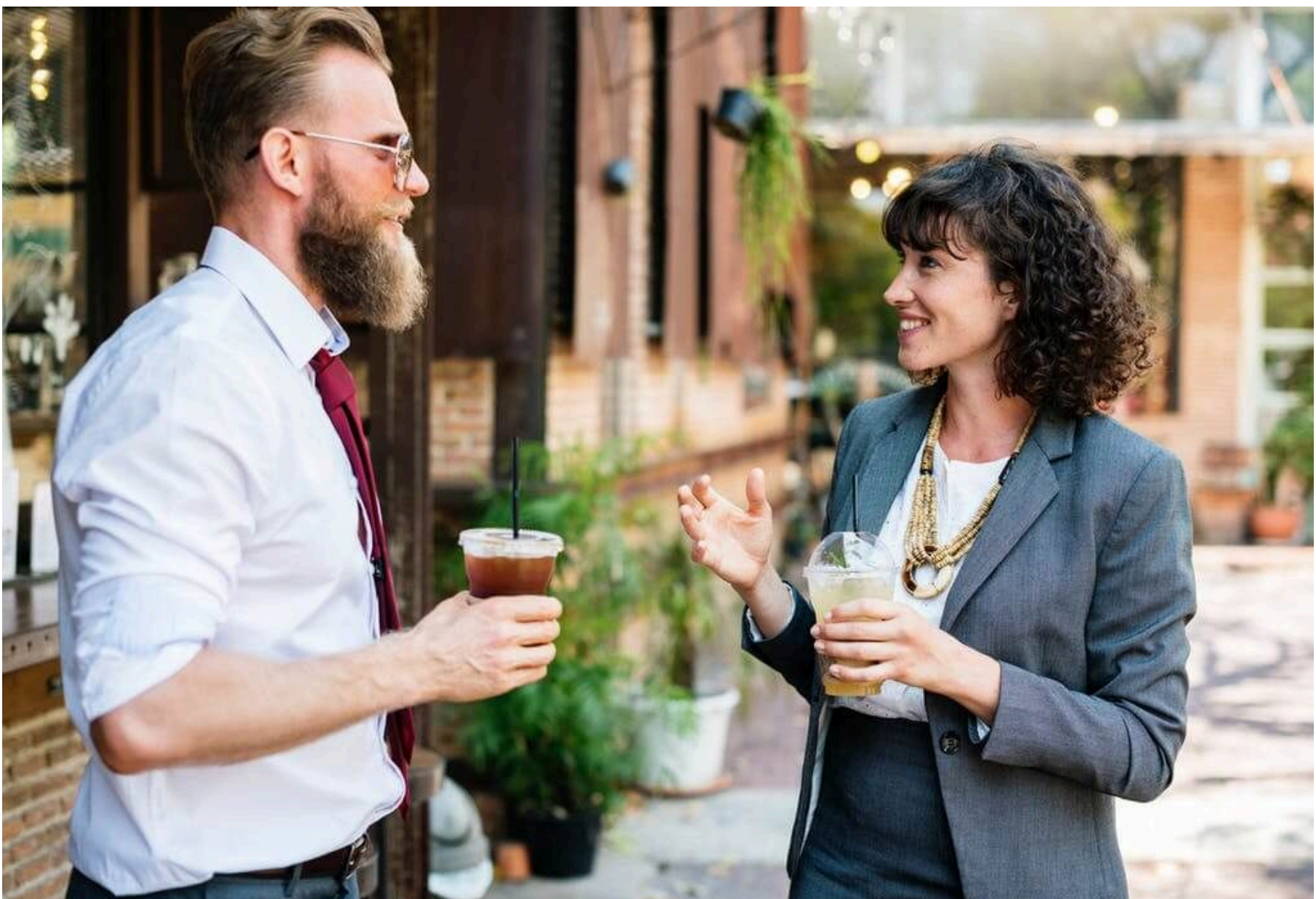
Benötigen Sie Perspektive und / oder Unterstützung? Sprich mit Fremden