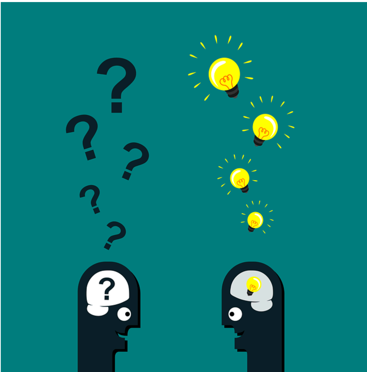
Der Unterschied zwischen Beton Vs. Abstraktes Denken